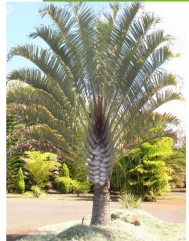
Palma trójkątna - gatunek endemiczny

- Godło jest otoczone przez napisy „Republikan'i Madagasikara”, oznaczający „Republika Madagaskaru”, oraz na spodzie „Tanindrazana - Fahafahana - Fahamarinana”, oznaczający „Ojczyzna - Rewolucja - Wolność”. Obok drugiego napisu znajdują się dwa kłosa zboża.